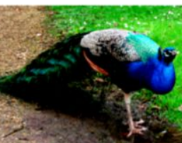
PAVONE PAVO REAL