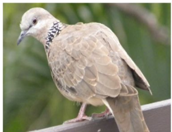
TORTORA GRIS PARDO