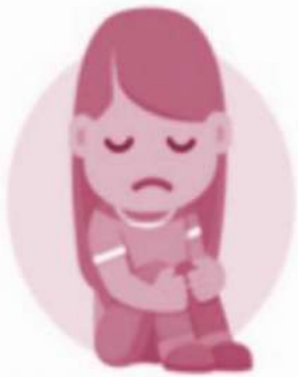
Maria è triste

avere sonno - avere caldo - essere arrabbiato - essere triste - avere fame - essere contento - avere sete - essere sorpreso - avere freddo