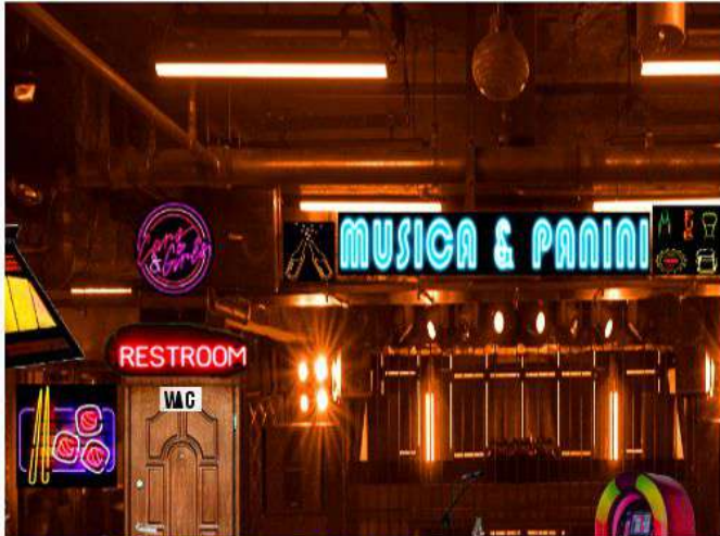
IL DJ E LE BALLERINE (CUBISTE) (EL DJ Y LAS BAILARINAS)