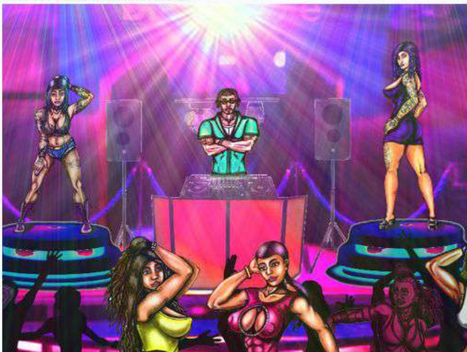
IL DJ E LE BALLERINE (CUBISTE) (EL DJ Y LAS BAILARINAS)