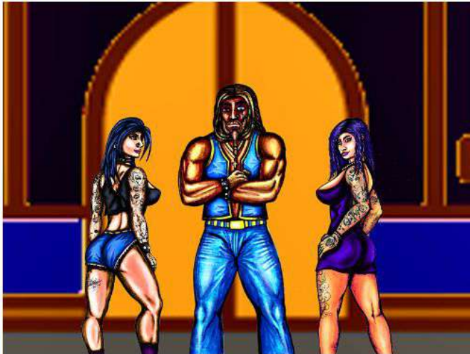
LA CASSA, IL CASSIERE E I CLIENTI (LA CAJA, EL CAJERO Y LOS CLIENTES)