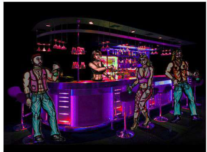
LA BARMAN (LA BARMAN - CAMERERA DE BARRA)